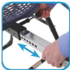
фигура 7 Позициите за настройка според ръста са обозначени в инчове и сантиметри.